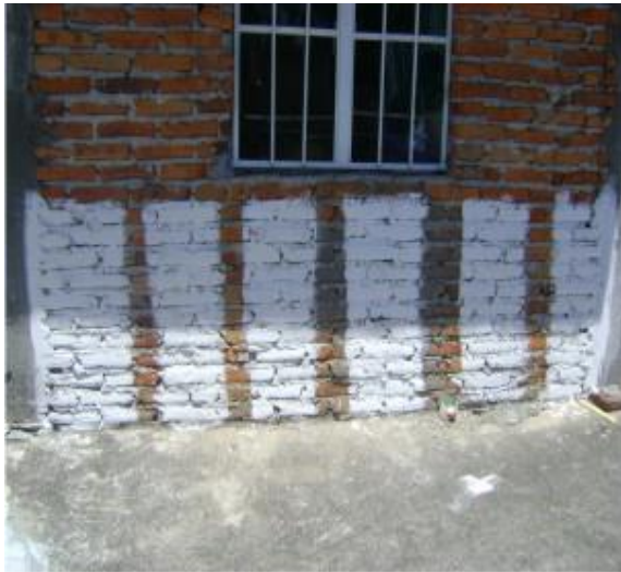
Figura 9. Pintura natural base cal y nopal en muros de tabique rojo. Izquierda para evaluarse en la calidad de diferentes pruebas. Derecha. Adicionada de colorantes azul, amarillo y gris frente a la base blanca.