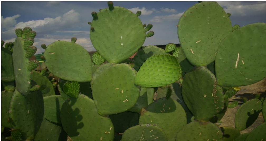
Figura 2. Pencas adultas de nopal utilizadas para la obtención del adhesivo de pinturas naturales tipo recubrimiento

Hasta ahora, la especie de nopal no pareciera ser relevante en términos de una tecnología casera, mientras se mantenga estandarizada la cantidad de adhesivo o baba por litro de pintura. El procedimiento de obtención y cuantificación del adhesivo es simple, primeramente se troza en cubos pequeños el corazón de las pencas de nopal y por cada kilogramo de material vegetal, se adiciona 1.5 litros de agua, se deja reposar 24h a temperatura ambiente. Posteriormente, se filtra y este material filtrado es el adhesivo para la preparación de la pintura.