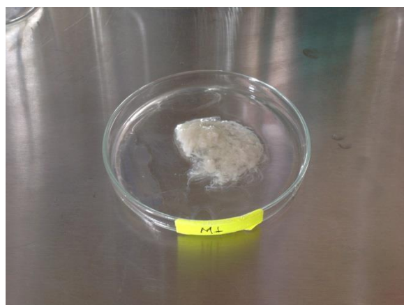
Figura 4. Adhesivo de nopal obtenido de 100 ml de filtrado retirado del medio alcohólico

El material que se presenta en la figura 4, se deja secar al aire, se pesa y se refiere la concentración de los gramos que resulten en 100 ml de adhesivo o baba líquida. Así con este valor de concentración (g/100 ml), se puede calcular el correspondiente volumen (ml) de baba que lleve 1 gramo para un litro de pintura, indistintamente de la fuente de nopal. La preparación de la pintura es una simple mezcla del agua que se adiciona a la cal pesada, continuada de la adición de sal de grano y constante agitación. Para finalizar con el adhesivo líquido o baba de nopal, ver figura 5, en esta figura se presenta la secuencia durante la agitación de la mezcla para obtener la pintura. Observar el momento en que se vierte el adhesivo a la mezcla de los otros ingredientes (agua con cal y sal de grano), inciso A y siguientes de la fotografía. Se observa, la formación de membranas o películas que manifiestan evidencia contundente que se está preparando una pintura tipo recubrimiento.