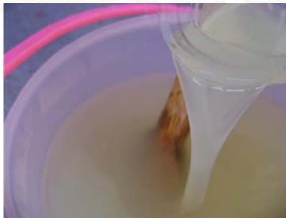
Figura 3. Adhesivo natural extraído de penca adulta de nopal.

El aspecto altamente viscoso del adhesivo (baba) al término de la extracción, es mostrado en la figura 3.