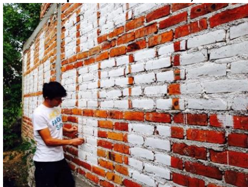
Figura 1. Muro de tabique rojo utilizado para ensayar las pinturas base cal. Establecido a la intemperie en Salvatierra, Gto.

Un análisis no presentado, hizo que la investigación avanzara sobre una única formulación de pintura, dirigiendo el trabajo sobre la que implicó el uso de adhesivo de nopal. Esta formulación fue optimizada en sus ingredientes tan solo tres y el solvente (agua), ver tabla 2. En la tabla se presenta la formulación final, que brindó el mejor desempeño en calidad de pintura, incluso frente a las comerciales base agua de mediana calidad.