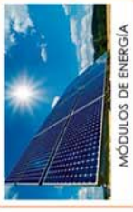
MÓDULOS DE ENERGÍA