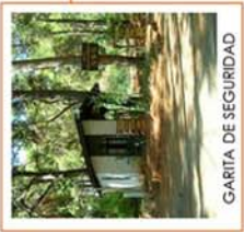
GARITA DE SEGURIDAD