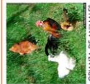
CRIANZA DE ANIMALES