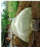
MÓDULOS DE ENERGÍA