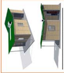
CASA SEMILLA DEL GUARDIAN