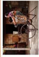
BICH-MÁQUINAS PARA PROCESOS AGRICOLAS